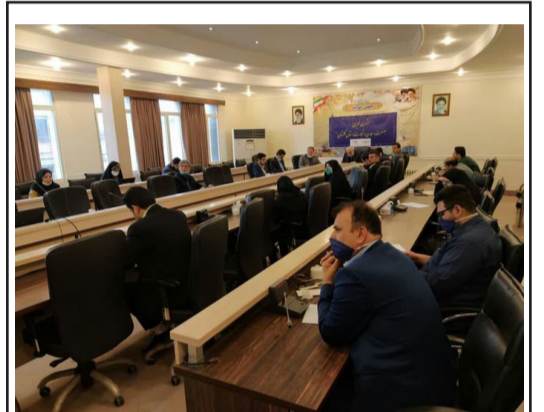
رئیس سازمان صمت گلستان خبر داد:

رئیس سازمان صنعت، معدن و تجارت گلستان افزود: در تسهیلات تبصره ۱۸ نیز که از جمله مهمترین ابزار ایجاد و حفظ اشتغال در استانها است، تا کنون درخواست هفتاد و پنج واحد در