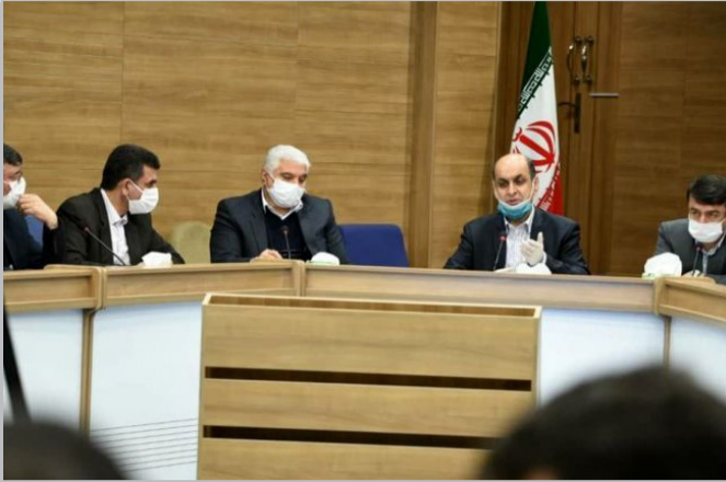
جذب و مابقی کالاها در حال جذب می باشد.

طلوعیان افزود: بخشی از کالاهای جذب شده در نیمه اول ماه مبارک رمضان در سطح استان توزیع شده و مابقی نیز به مرور تا پایان این ماه توزیع خواهد