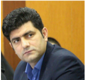
سرپرست ملی امنیتی

با توجه به اینکه در بحران کرونا آسیب های جدی به تمامی بخش های اقتصادی، اجتماعی، فرهنگی و به طور کلی موجب مختل شدن فعالیت های مختلف در تمام دنیا شده است، اکنون که به اصطلاح در دوران پسا کرونا به سر میبریم و یا حداقل متوجه شده ایم که چگونه با رعایت مسائل بهداشتی در کنار کرونا به زندگی اجتماعی خود بازگردیم لازم است تا باری دیگر مولفه های سرمایه اجتماعی مانند مشارکت و شکوفایی اجتماعی را بنا بر اقتضای شرایط تقویت و آسیب های کووید-۱۹ را تا حد امکان جبران کنیم لذا از آنجایی که دوران قرنطینه موجبات خودسازی و تقویت استعداد های نهفته را برای کسانی که از زمان خود به نحو احسن استفاده میکنند فراهم آورده است، این انتظار از مدیران اجتماعی میرود که با تشکیل اتاق فکر چاره ای بر این زخم ناشی از کرونا ببندیشند.